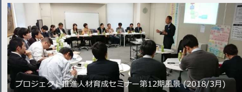
プロジェクト推進力育成セミナー第12期風景 (2018/3月)