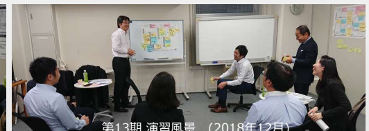
第13期 演習風景 (2018年12月)